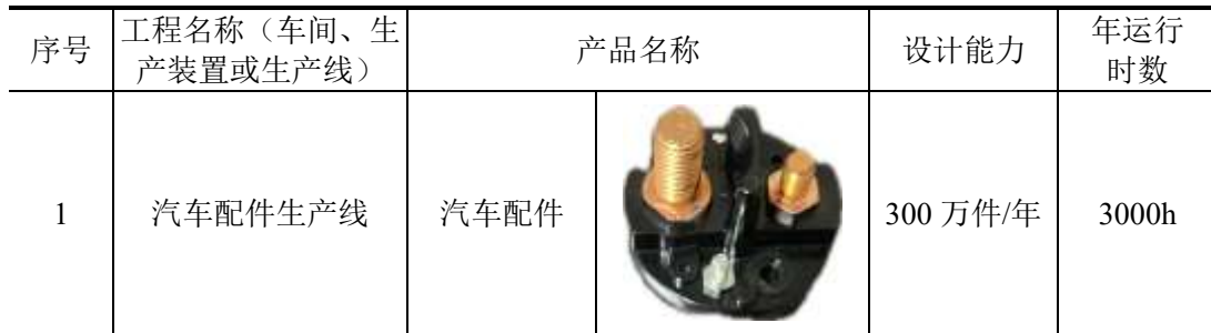
表 2-1 建设项目主体工程及产品方案